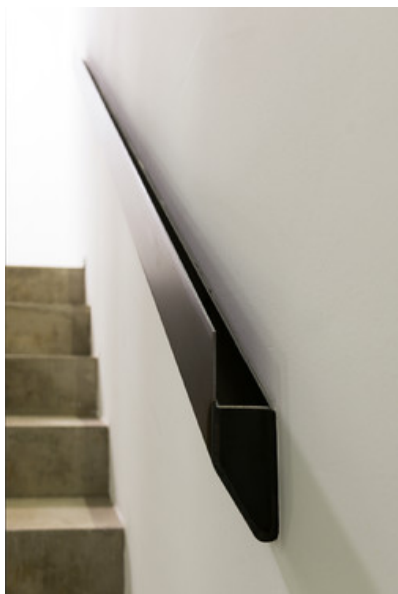
ANTHE - Bureau Â© Luc Spits