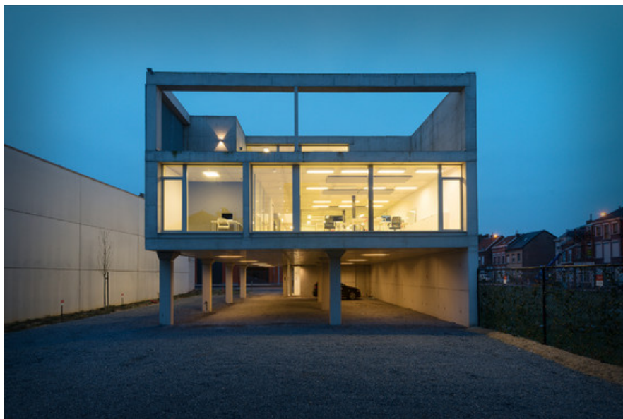
ANTHE - Bureau