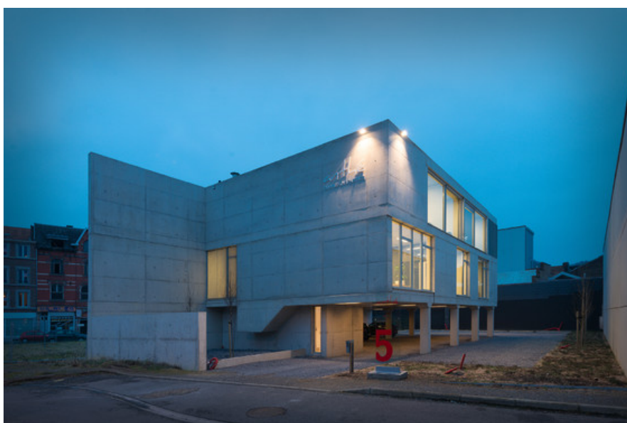
ANTHE - Bureau