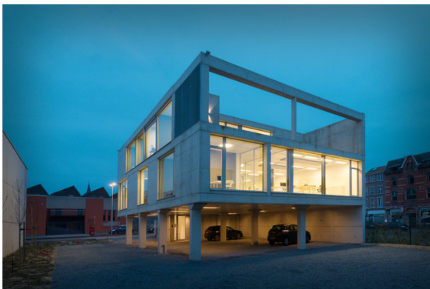
ANTHE - Bureau