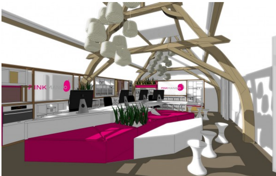
Bureau Â© MADe alchimie cr  ative s.p.r.l.