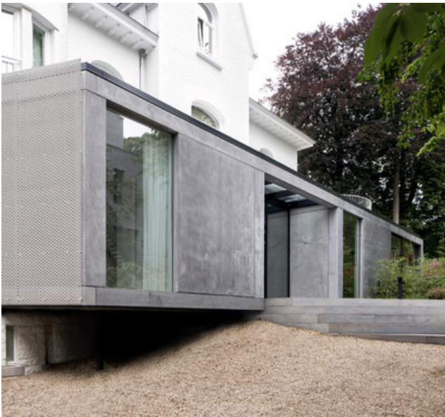
Â© MDW Architecture