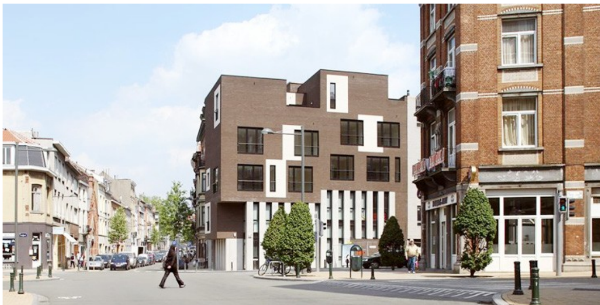
Â© ARJM architecture et urbanisme