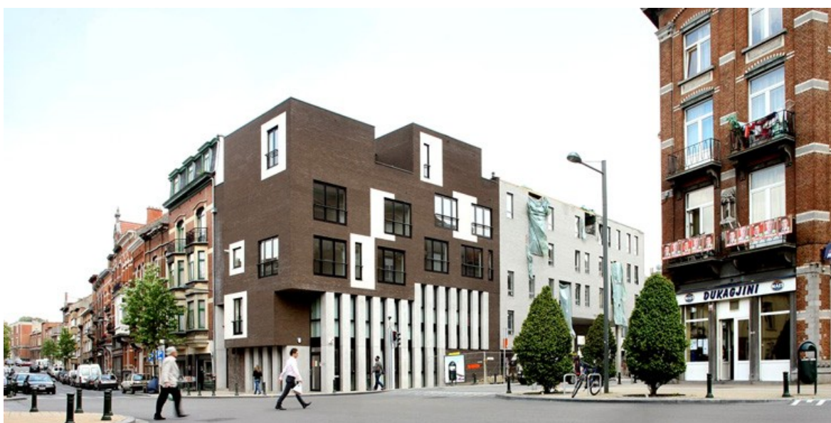
Â© ARJM architecture et urbanisme