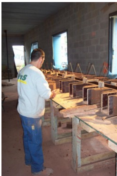
Â© Mario Garzaniti