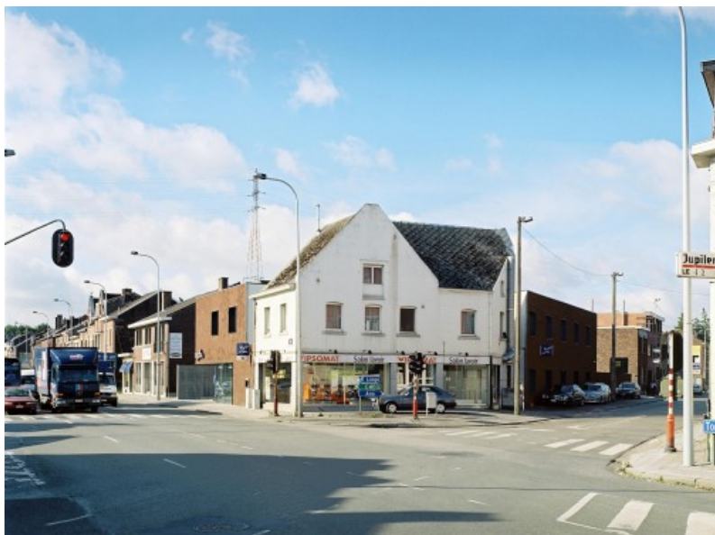
Â© Alain Janssens