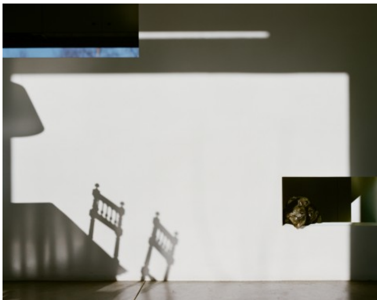
pour les 10 ans de bois et habitat