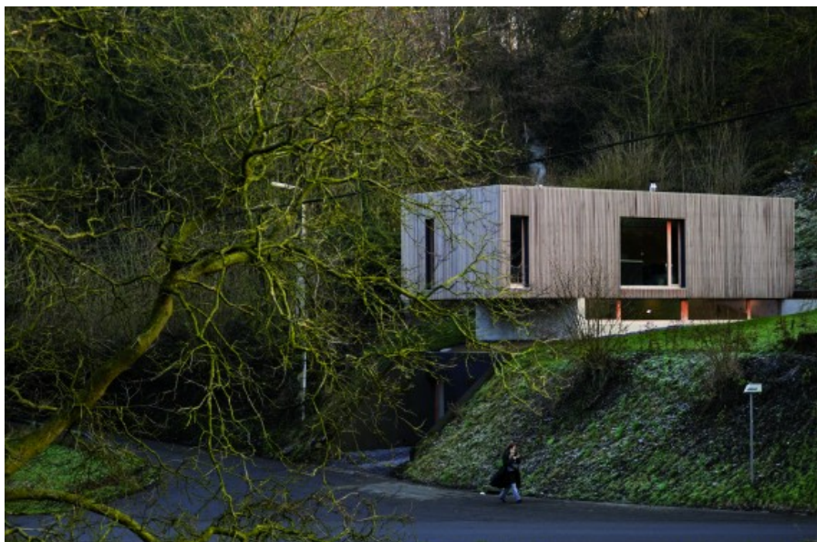
Â© Marie-Françoise Plissart pour les 10 ans de bois et habitat