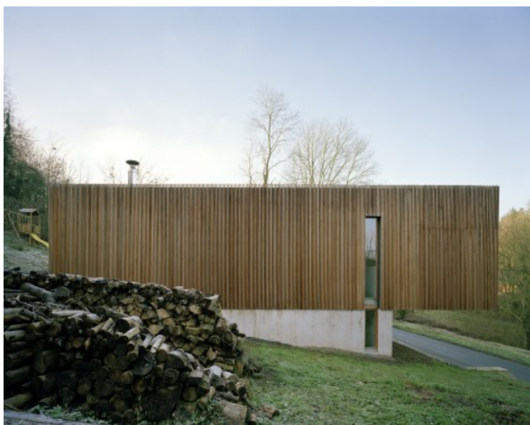
Â© Martiat+Durnez Architectes