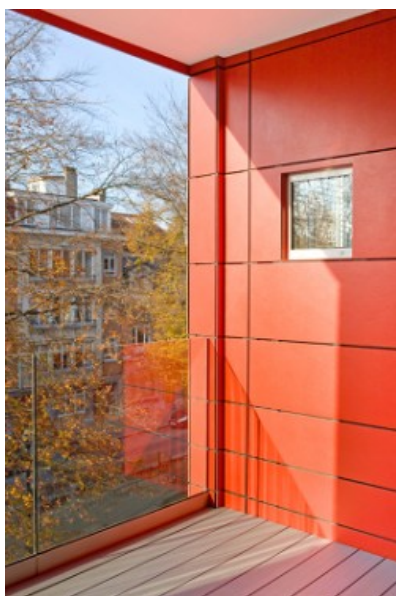
Â© Laurent Brandasj