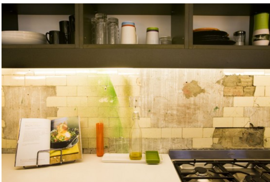
Â© MichÃ¨le Verhelst architect