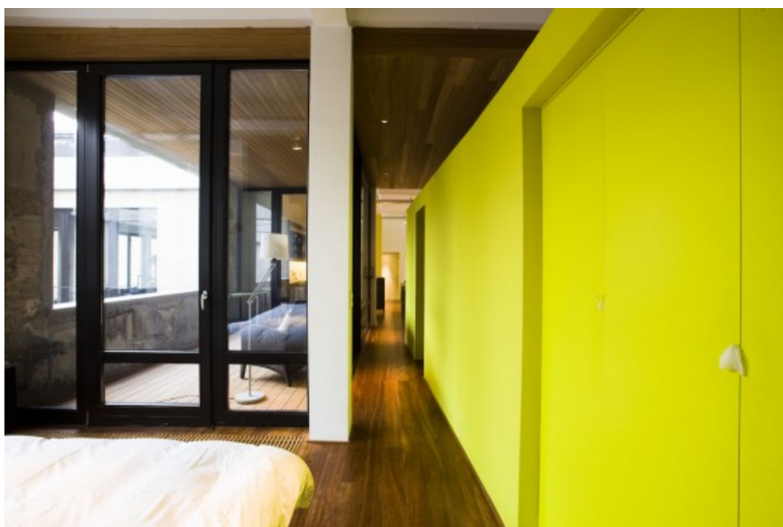
Â© MichÃ¨le Verhelst architect