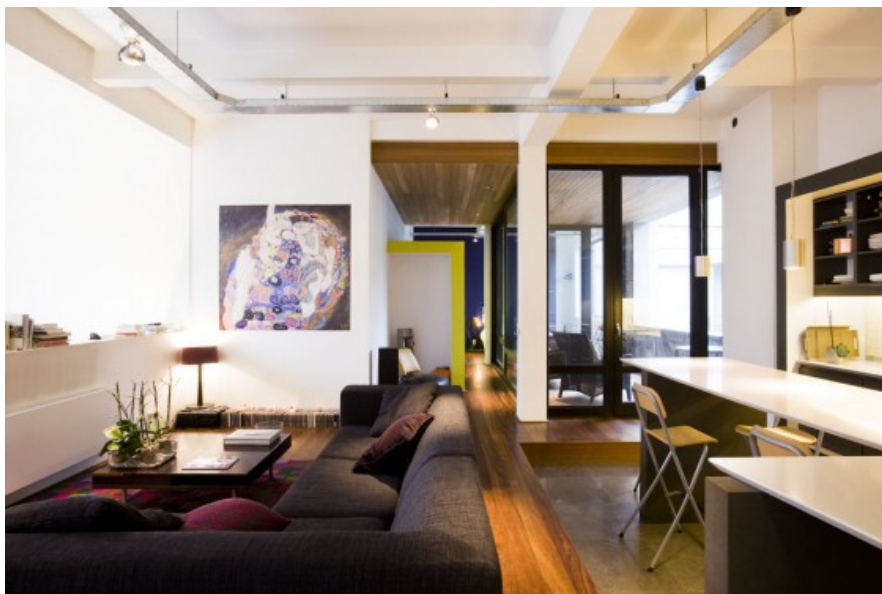
Â© MichÃ¨le Verhelst architect