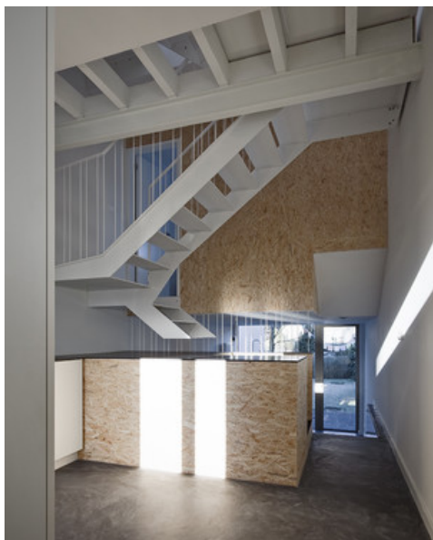
Â© Monsieur Pascal