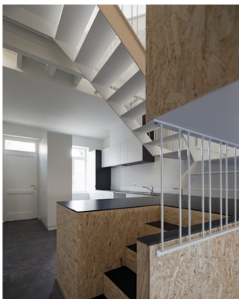
Â© Monsieur Pascal