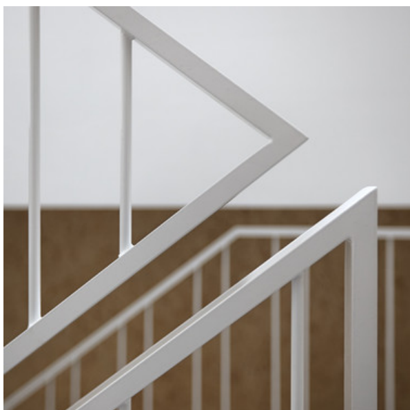
Â© Monsieur Pascal