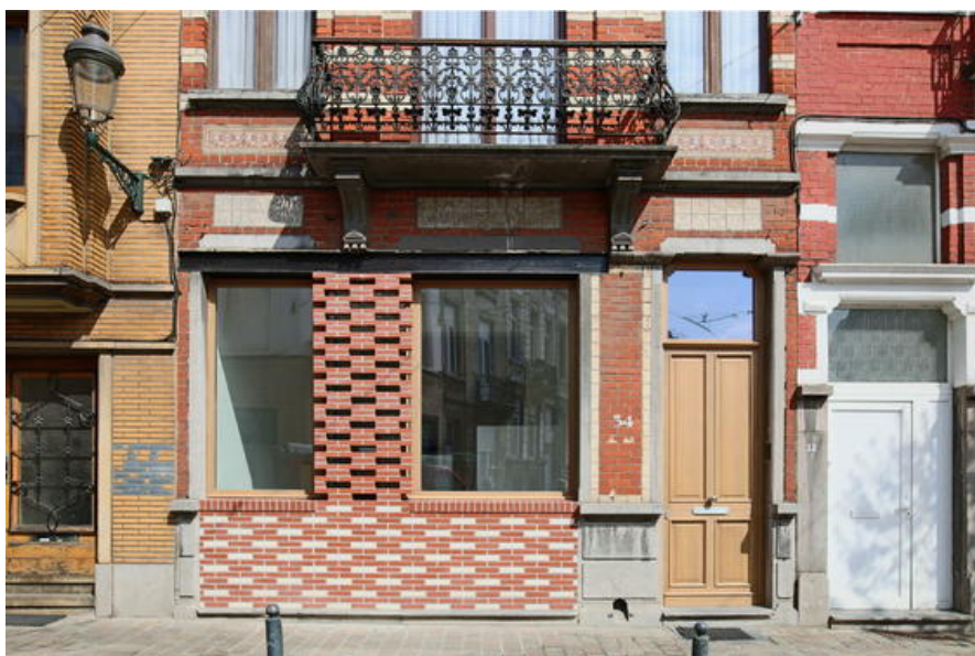
Â© Monsieur Pascal