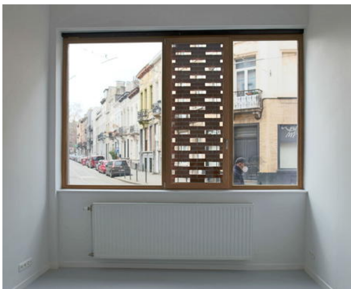
Â© Monsieur Pascal