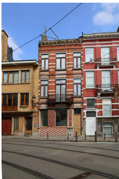
Â© Monsieur Pascal