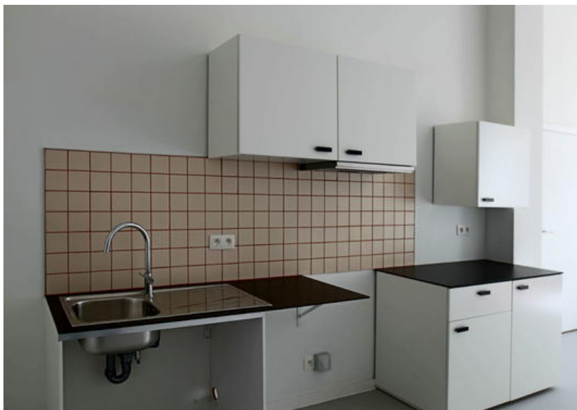
Â© Monsieur Pascal