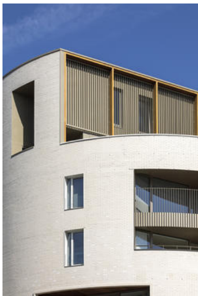
Â© Olivier Fourneau Architectes scprl