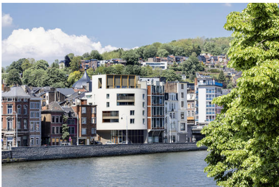
Â© Olivier Fourneau Architectes scprl