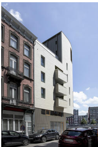
Â© Olivier Fourneau Architectes scprl