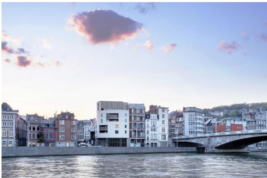
Â© Olivier Fourneau Architectes scprl