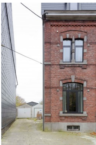
Â© Severin Malaud