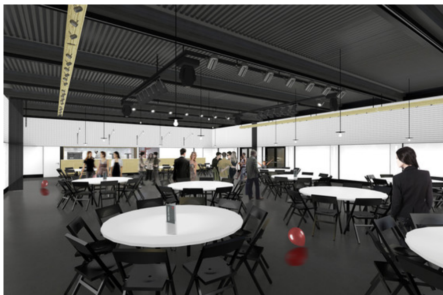
À© P&P architectes