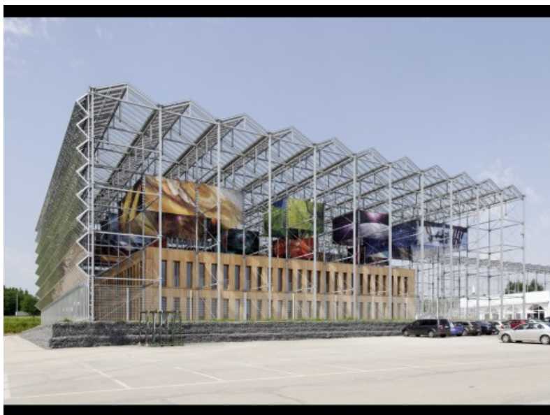
Â© Marie-Françoise Plissart