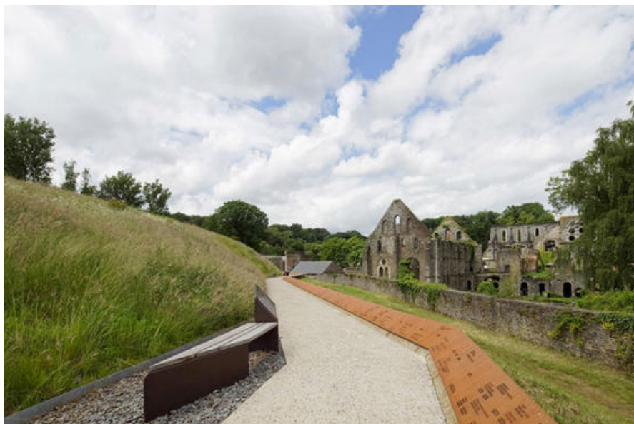
Villers - parcours vers les ruines