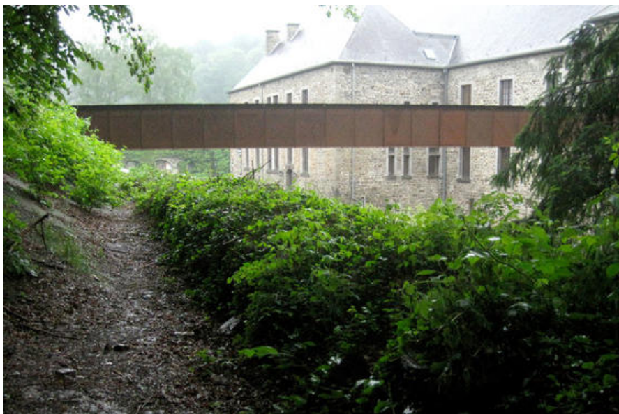
Villers - parcours vers les ruines