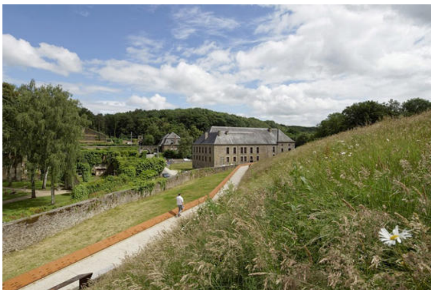
Villers - parcours vers le moulin