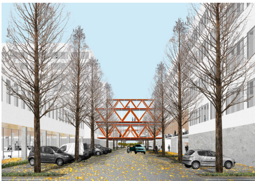
L'allée centrale