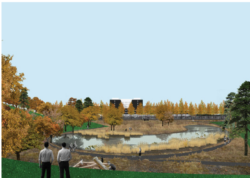
Vue de l'hôpital depuis le parc