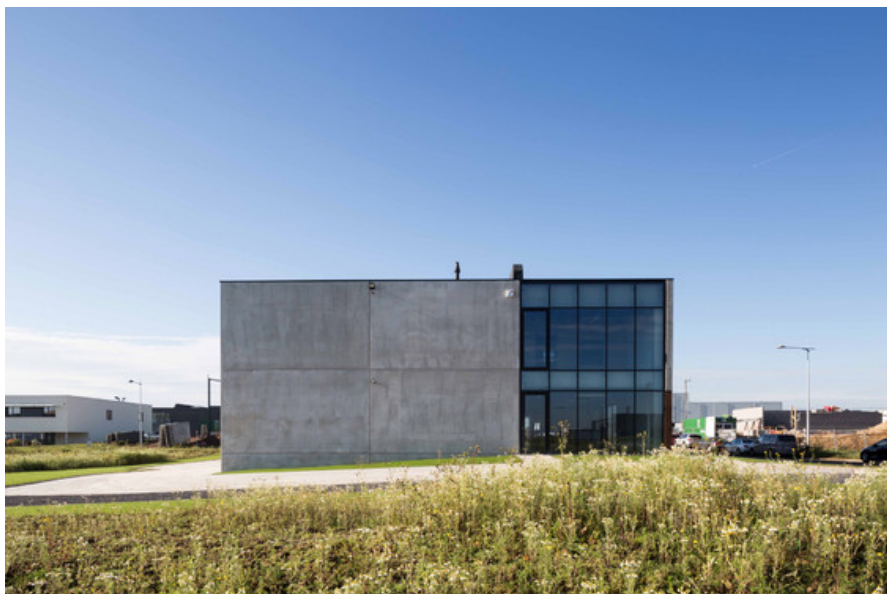
Construction dâ€™un entrepôt et des bureaux Provera Â© S  verin Malaud