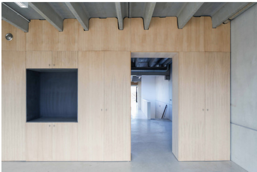
Construction d'un entrepôt et des bureaux Provera