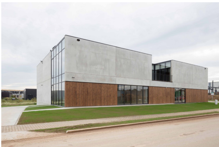
Construction dâ€™un entrepôt et des bureaux Provera Â© S  verin Malaud