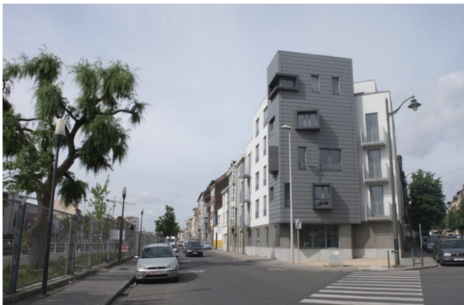
Â© ROOSE PARTNERS ARCHITECTS