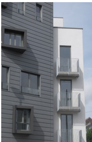
Â© ROOSE PARTNERS ARCHITECTS