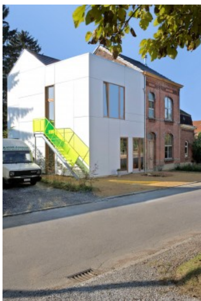
Façade avant