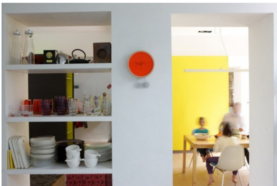
vue intérieure © Brandajs