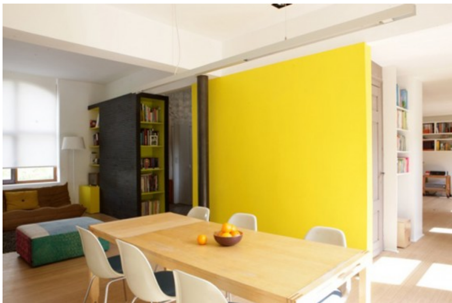
vue intérieure