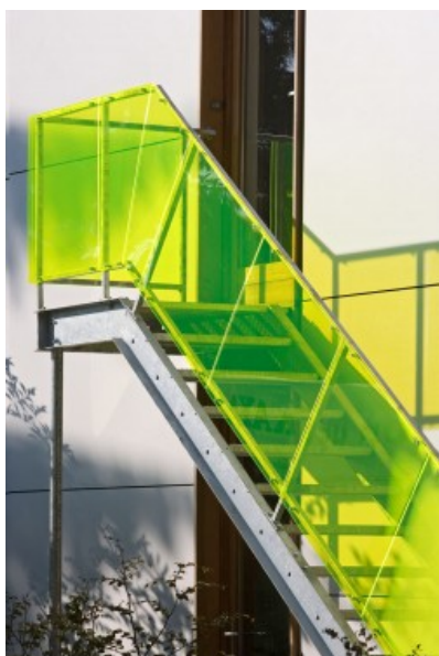
Escalier / plexiglas jaune Bardage et garde-corps