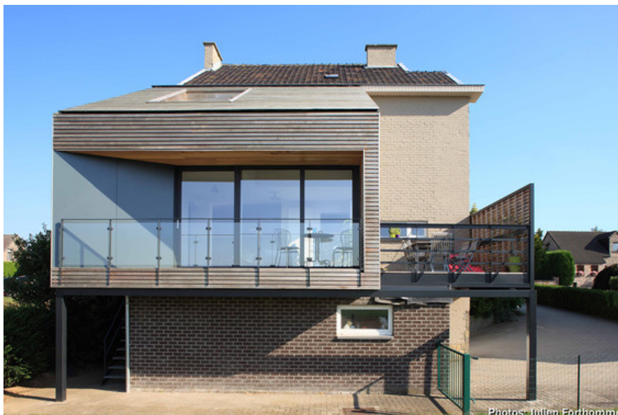
Extension sur le garage existant. Bardage en lattes de CÃdre ajourÃes et panneaux noirs.