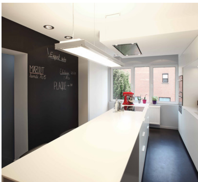
Cuisine en Corian blanc. Peinture murale "tableau". Sol en Epoxy anthracite.