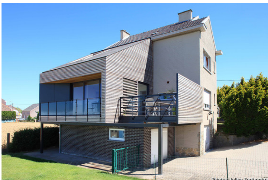
Extension sur le garage existant. Bardage en lattes de CÃdre ajourÃes et panneaux noirs.