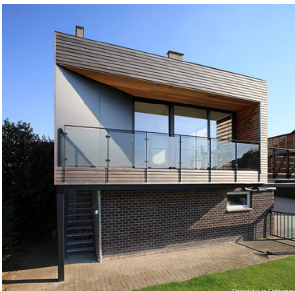
Extension sur le garage existant. Bardage en lattes de CÃdre ajourÃes et panneaux noirs.