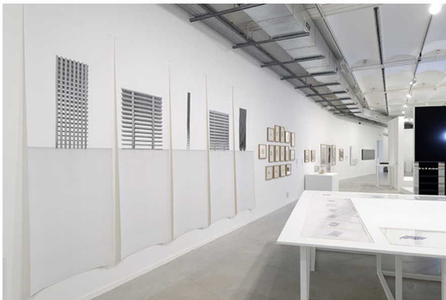
GESAMTCOLLAGE, exposition, FRAC CENTRE, Orl  ans (FR)    Studio SNCDA