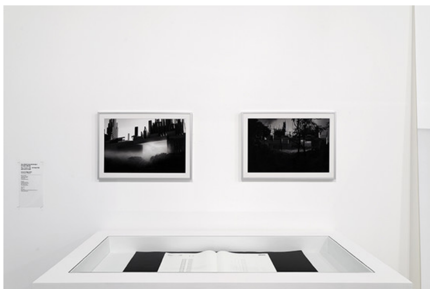
GESAMTCOLLAGES, exposition, FRAC CENTRE, Orléans (FR)