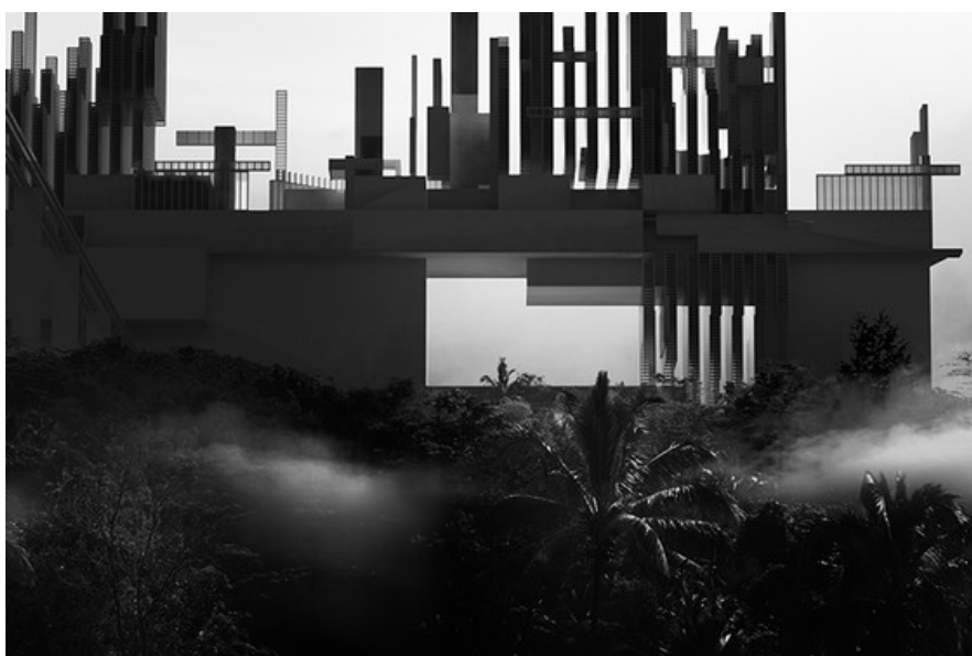
GESAMTCOLLAGE, Central Park    Studio SNCDA