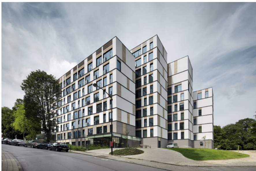
Â© Urban Platform