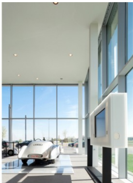
Â© Tim Vandeveld