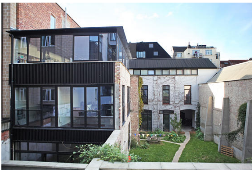
projet ANHO © Vanden Eeckhoudt-Creyf architectes