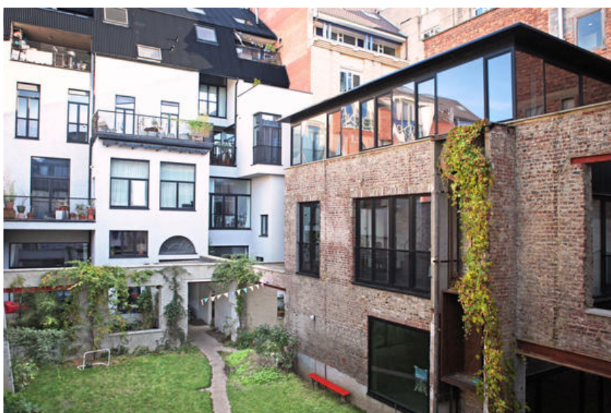
projet ANHO © Vanden Eeckhoudt-Creyf architectes