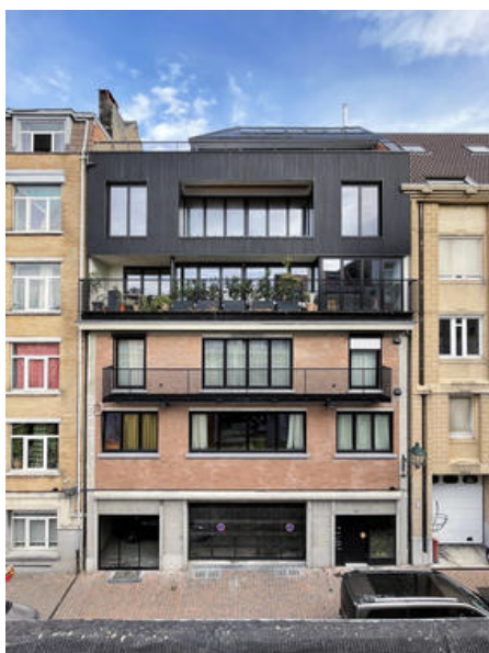
projet ANHO © Vanden Eeckhoudt-Creyf architectes