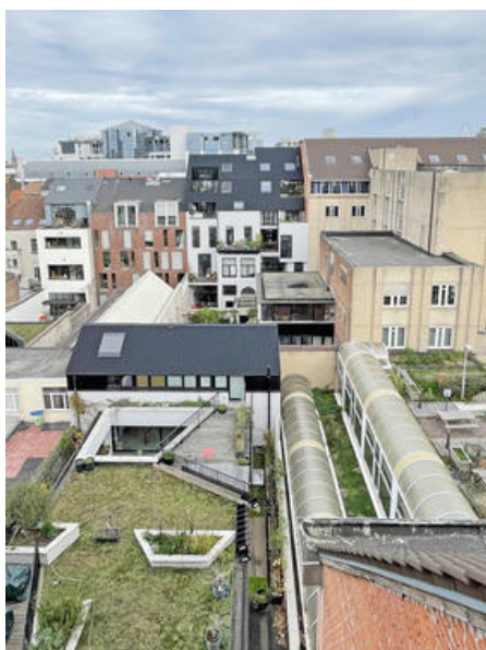
projet ANHO © Vanden Eeckhoudt-Creyf architectes