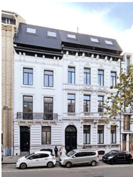
projet ANHO © Vanden Eeckhoudt-Creyf architectes