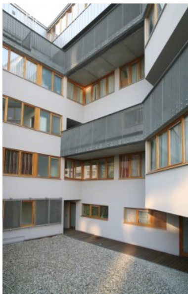
Â© Michel Vanden Eeckhoudt