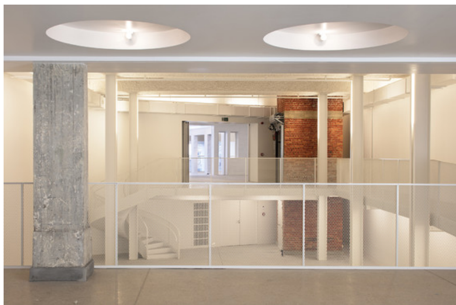
Â© Vers plus de bien-Ãatre V+