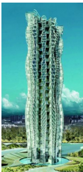
Â© WHY architecture