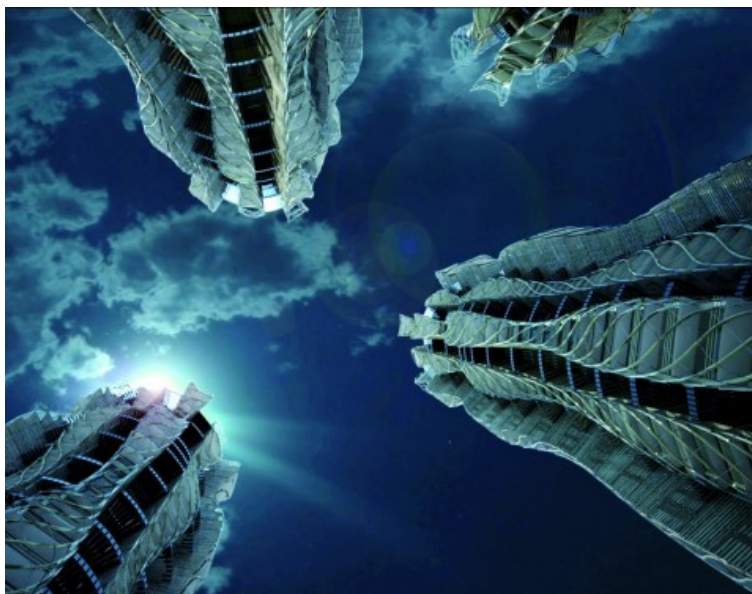
Â© WHY architecture