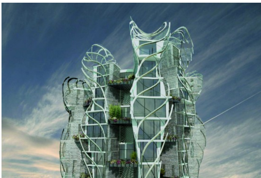
Â© WHY architecture