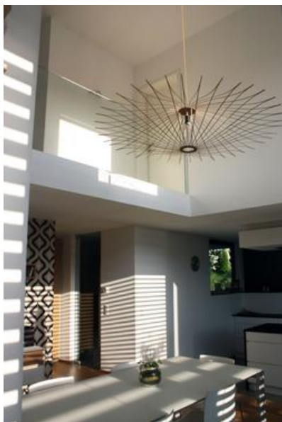
Â© acmia - atelier d'architecture