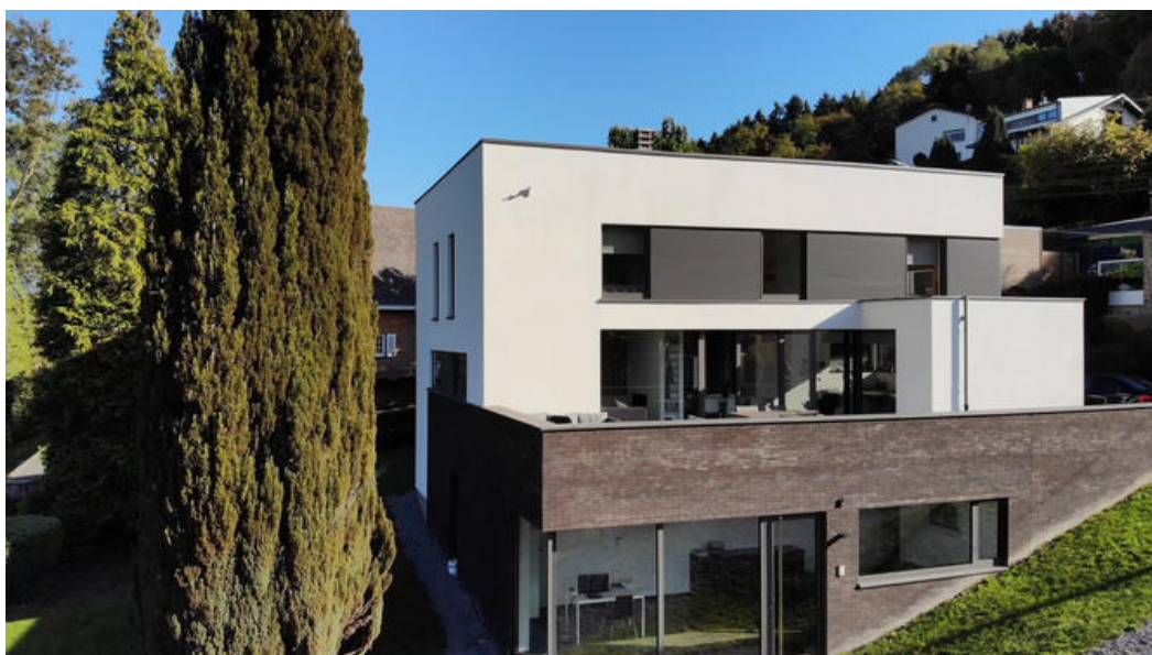
Â© acmia - atelier d'architecture