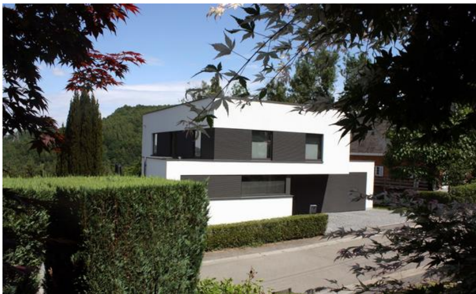
Â© acmia - atelier d'architecture