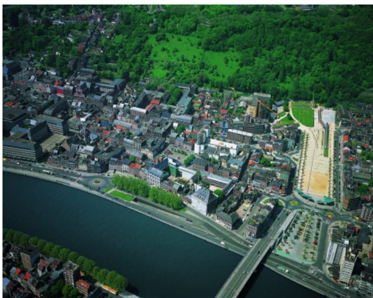
Vue aérienne 2002