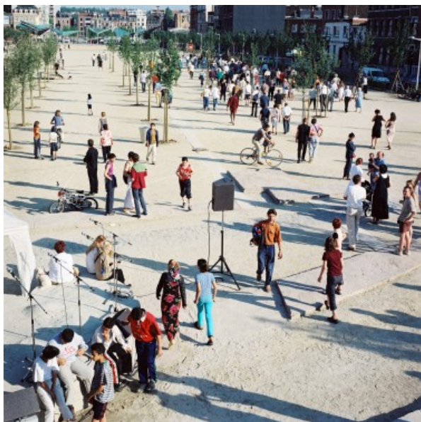
Â© Alain Janssen