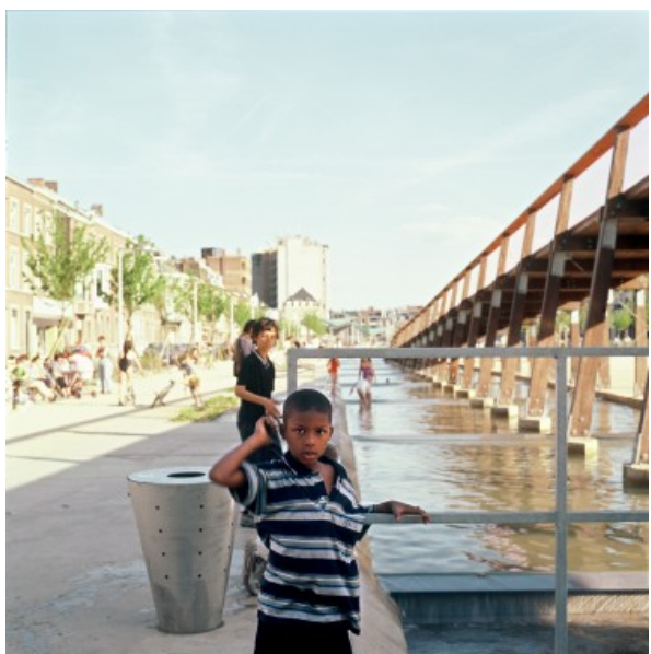
Â© Alain Janssen