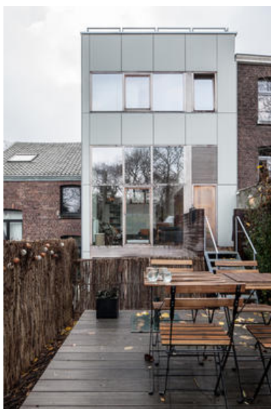
JONQUILLES-Façade arrière