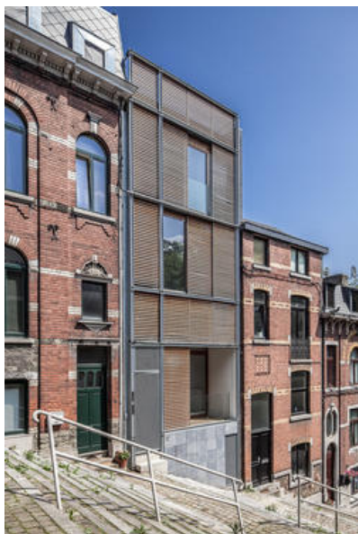
JONQUILLES-Façade avant