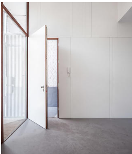
JONQUILLES-Studio Â© Defourny S.