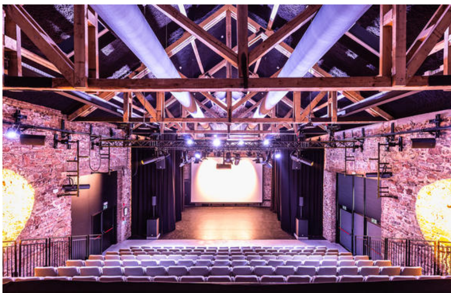
Maison rurale 4