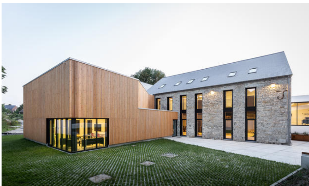
Maison rurale 1 Â© Utku Pekli