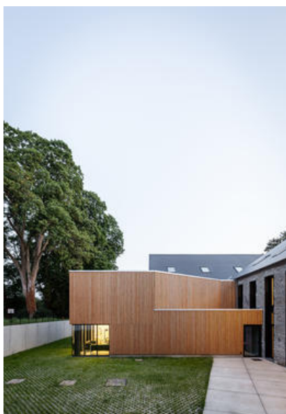
Maison rurale 2