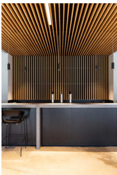
Maison rurale 5