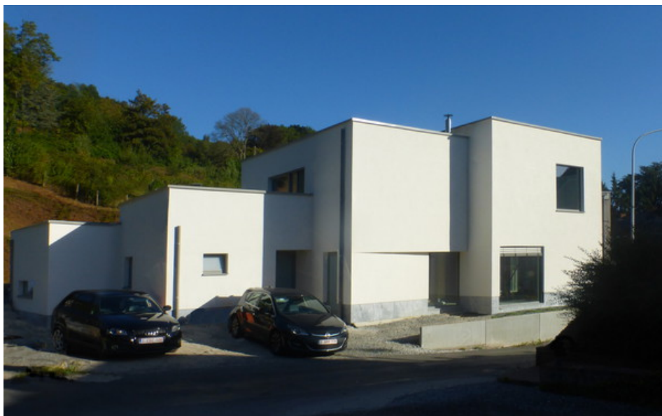
Vue latérale