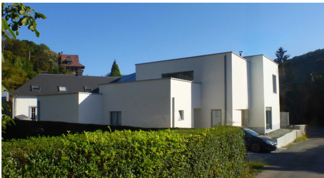
vue arrière