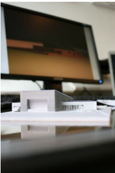
Maquette d'étude © helium3 architectures

Logements Green Tilleur - 2010 2014 - Tilleur