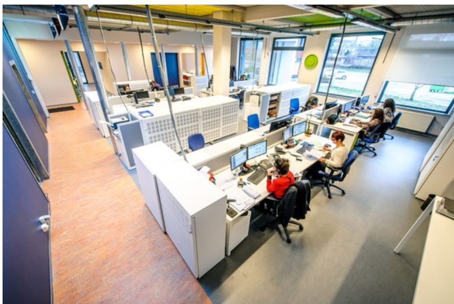
Â© helium3 architectures