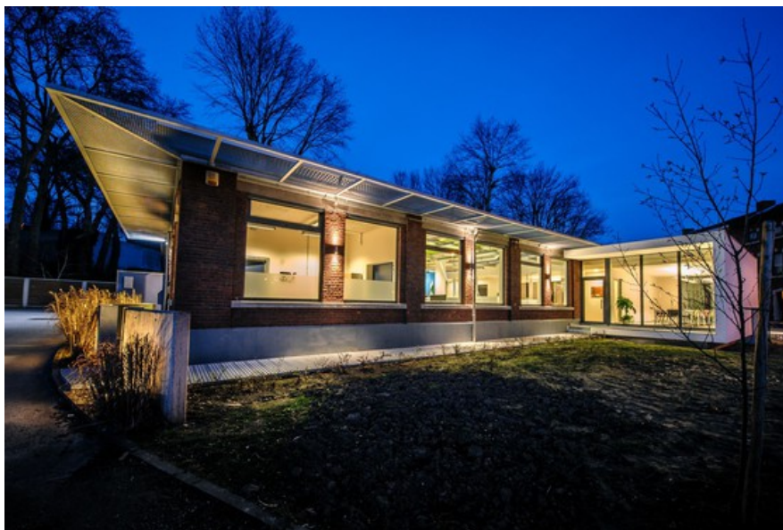
Â© helium3 architectures