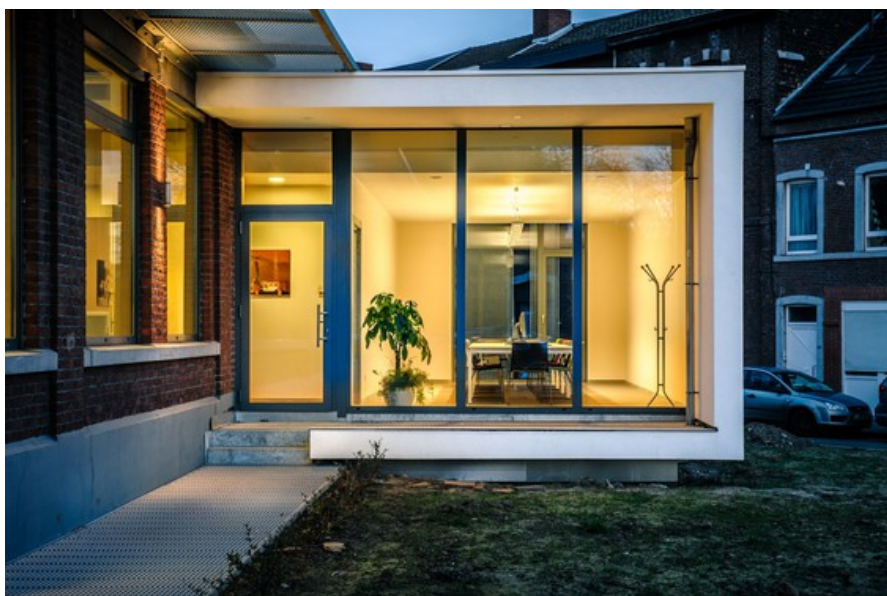
Â© helium3 architectures