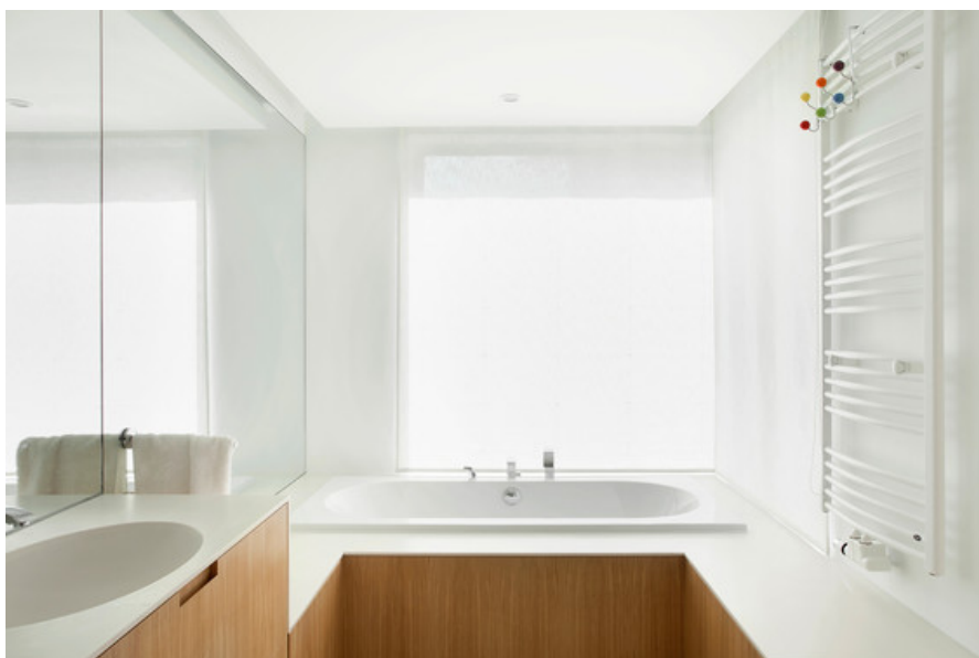
Â© Maxime Delvaux