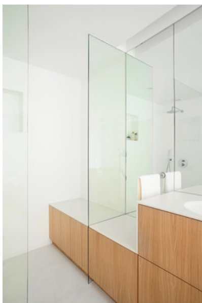
Â© Maxime Delvaux