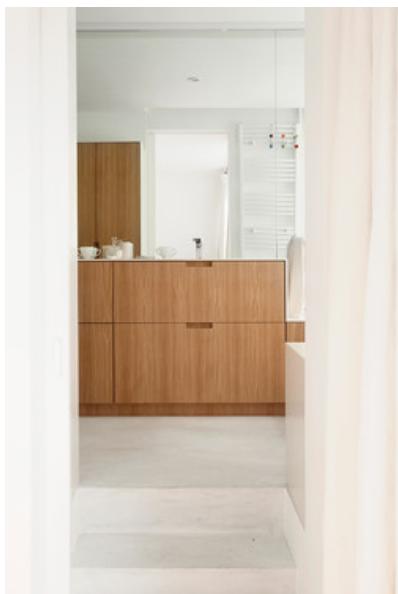
Â© Maxime Delvaux