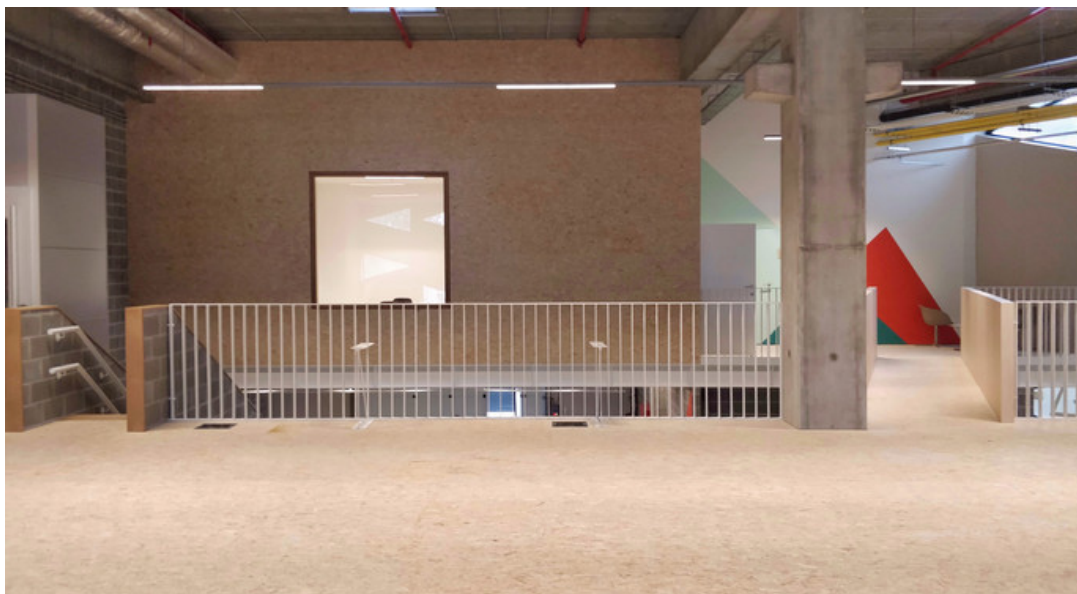
Â© oPla architecture