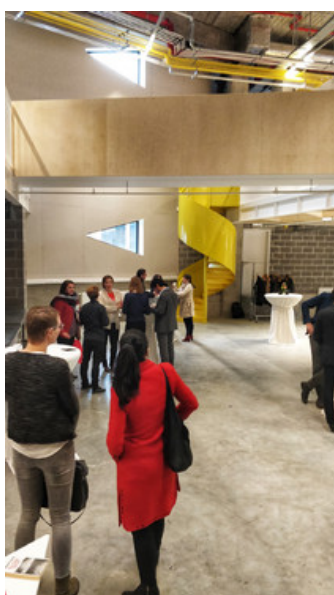
Â© oPla architecture