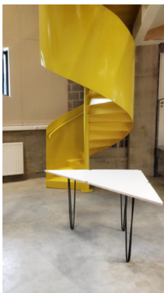
Â© oPla architecture