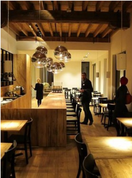
Â© oPla architecture sc prl