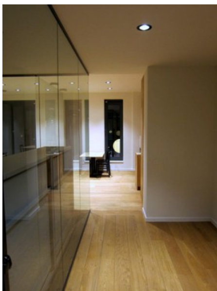
Â© oPla architecture sc prl