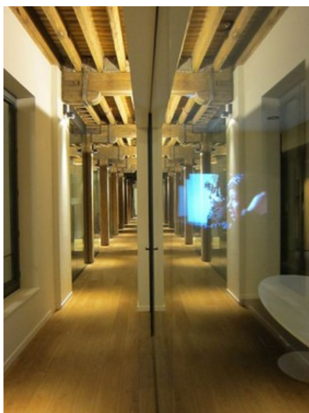
Â© oPla architecture sc prl