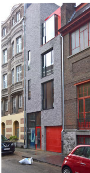
Façade avant © van der Plancke architecte s.r.l.