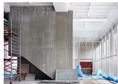
V+ PHENIX5 EXE