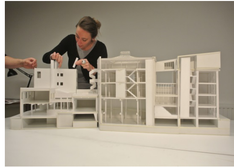
V+ MAD AVP Maquette 1-50 grande coupe

Le nouveau Mode and Design Center (MAD) est le résultat d'une collaboration entre V+ et le collectif Rotor. Le projet de rénovation comprend plusieurs espaces d'exposition et de réception, des bureaux, des ateliers et une cafeteria. Les architectes ont choisi de conserver les trois bâtiments existants, très différents entre eux et presque inadaptés à leur nouvelle fonction, en revoyant totalement les circulations. Il en découle une riche variété spatiale, unifiée grâce à l'usage d'une vaste palette de matériaux blancs, qui détournent l'image du white cube et dont Rotor montre une sélection dans l'exposition.