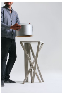
V+ GHLIN EXE maquette 1-50 © Maxime Delvaux