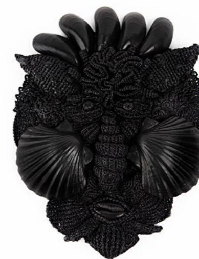
2 Fatu huku, 2022 Masque décoré de coquillages en raphia crochété à la main. Véritables coquillages recouverts de cuir d'agneau recyclé. Moules en métal recouverts de cuir d'agneau recyclé 35 x 25 cm