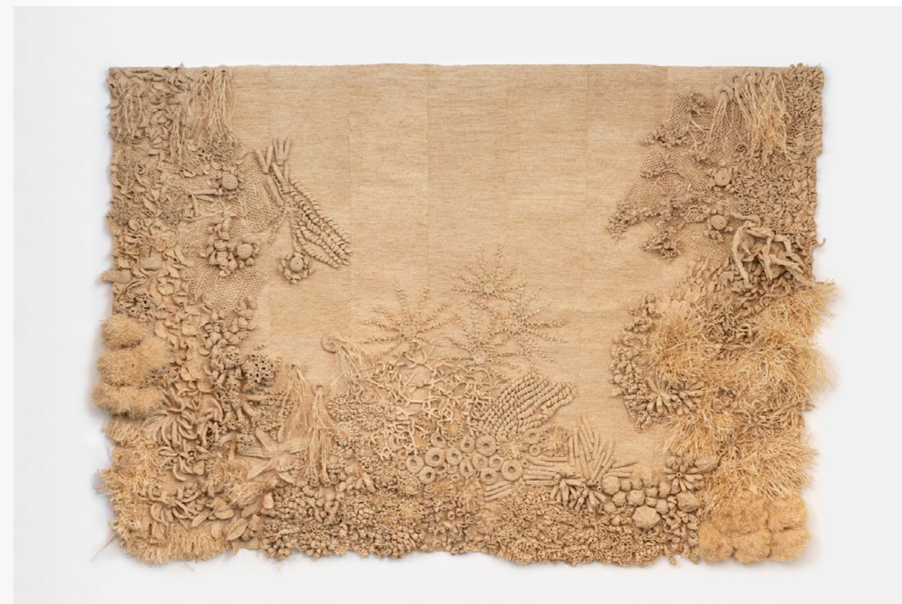
1 Paradise, 2022 Tapisserie entièrement crochété à la main en raphia naturel 260 x 160 cm

Les tapisseries et objets en raphia sont réalisées dans un atelier familial à Madagascar. Natalia Brilli intervient ensuite sur les pièces pour le travail de gainage. Tous les cuirs proviennent des stocks dormants des maisons et tanneries de luxe françaises et italiennes, raison pour laquelle, la plupart des créations sont des éditions limitées et numérotées. Pour le mobilier la créatrice collabore avec des ébénistes belges.