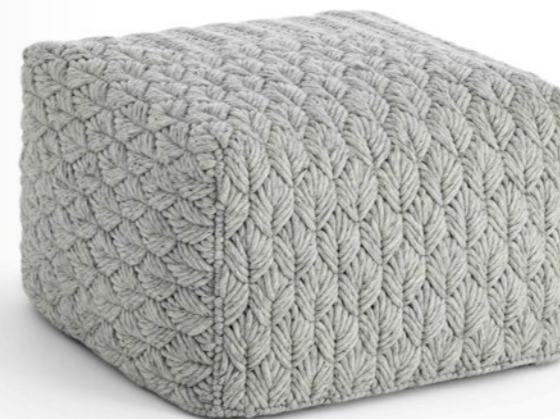
2 Chaddar Charlotte Lancelot for GAN Pouf, 2021 Fabrication artisanale 100% laine. Maille en fibre de verre recouverte de PTFE. Remplissage: 100% mousse de caoutchouc 52x52x35h