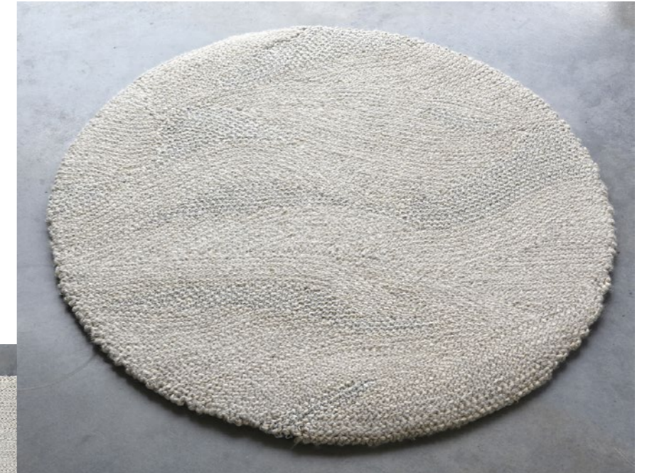
1 Slow, 2022 Tapis 95% lin, 5% lurex Ø 100 cm

Le lin est un matériau naturel et écologique. Il est produit localement, sa culture nécessite peu d'eau et subit des traitements chimiques très légers. Le lin présente également des avantages pratiques : il est un bon isolant acoustique, anti-poussière et régule la température et l'humidité de son environnement.