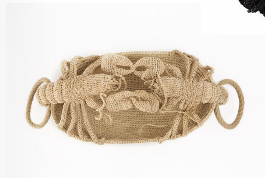
3 Panier-homard, 2022 Édition limitée à 100 pièces en raphia crochété à la main, dessous du panier et anses en corde de chanvre gainées d'agneau recyclé 40 x 22 x 10 cm