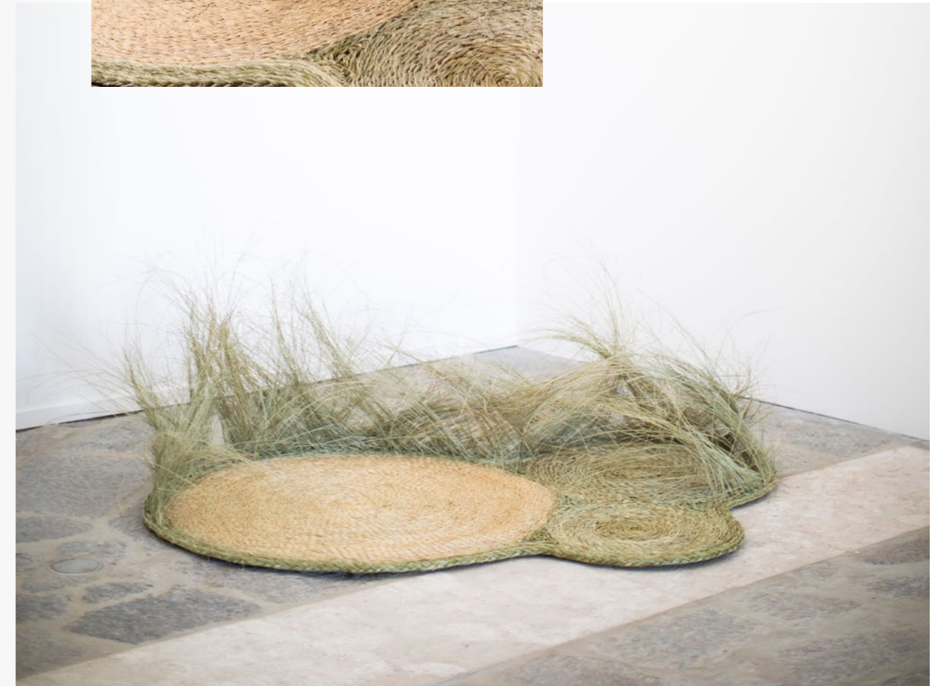
1 Clareira, 2021 Stipa Gigantea, cordelette de lin 173 x 115 x 51 cm