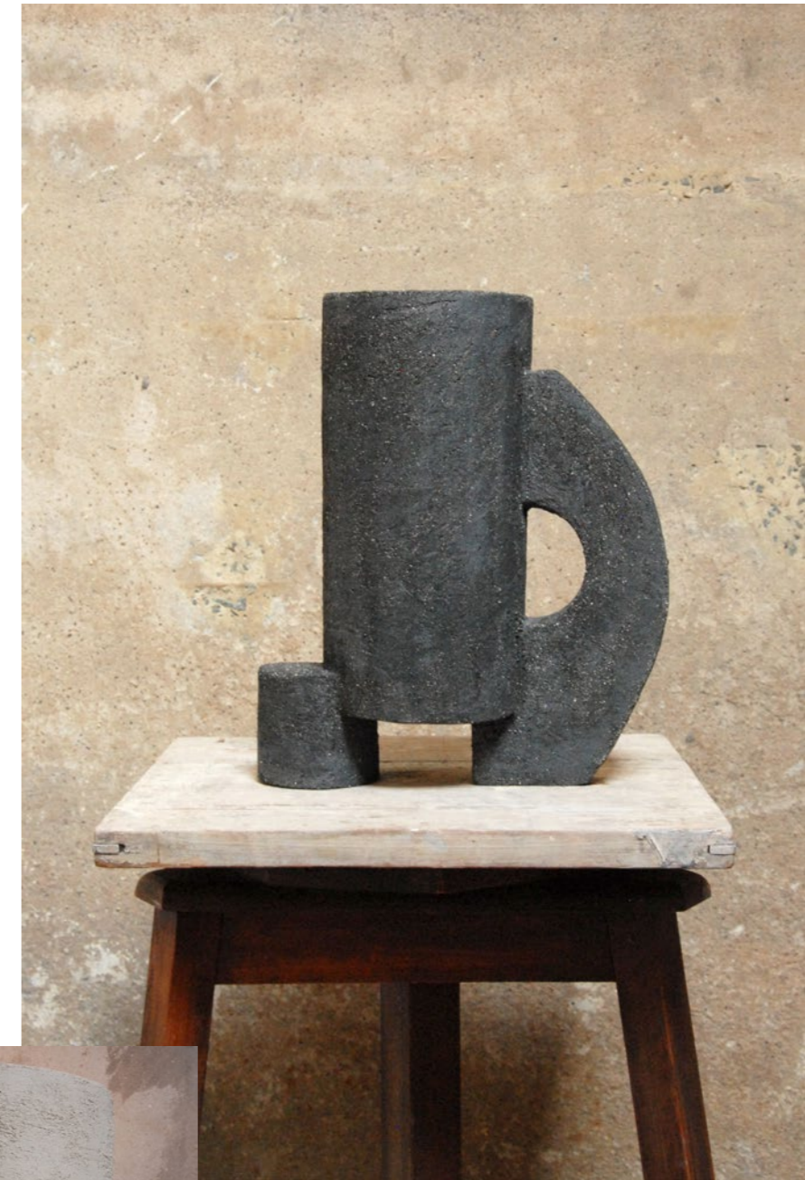
1 Antonio, 2022 Vase Argile noire espagnole H 39 cm L 33 cm P 17 cm