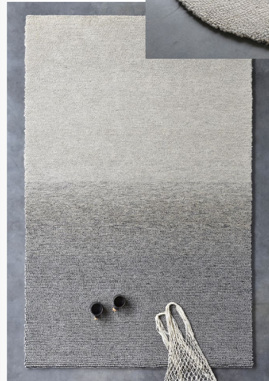
2 Shades, 2022 Tapis 90% lin, 10% autres fibres 120x180 cm