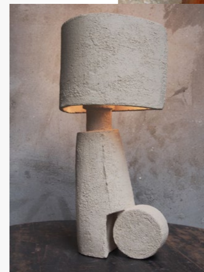
2 Paola, 2022 Lampe Argile blanche espagnole H 45 cm L 25 cm P 18 cm