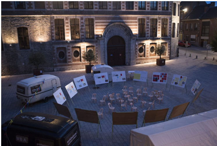
architectures ! inventaire collectif Tournai, 2019