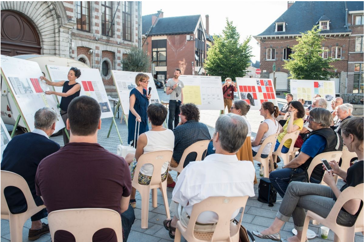
architectures ! inventaire collectif Tournai, 2019

Ce livre choral, composé de multiples citations et visuels, dresse un portrait hétérogène d'architectures incarnées et propose des pistes concrètes pour les maîtres d'ouvrage publics et privés ainsi que pour tout habitant soucieux de son environnement.