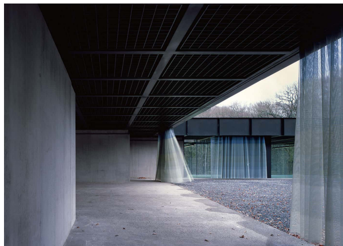
La Fraineuse, centre sportif, Spa

En 2019, A+ Architecture in Belgium et BOZAR co-produisent une nouvelle série d'expositions monographiques consacrées aux bureaux d'architecture belges qui ont retenu l'attention de la scène internationale ces dernières années. La deuxième exposition de cette série, Performance & Performativity , est consacrée au bureau d'architecture bruxellois BAUKUNST, fondé par Adrien Verschuere en 2008.