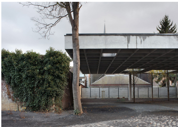
Quatre-vents, Bruxelles