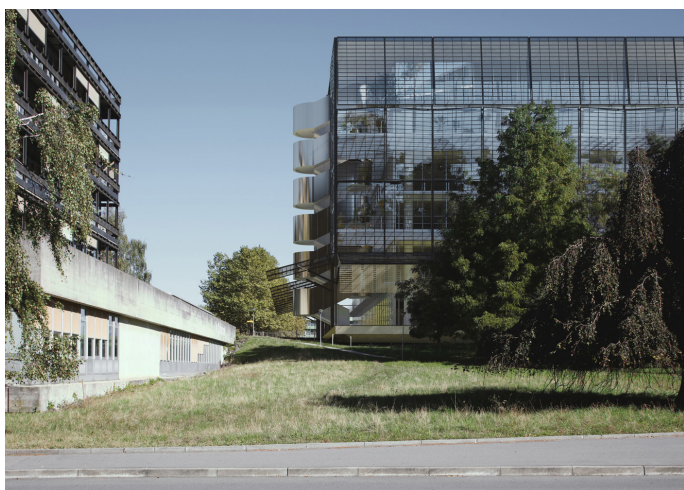
Bâtiment des Sciences de la vie, en collaboration avec Bruther, Lausanne