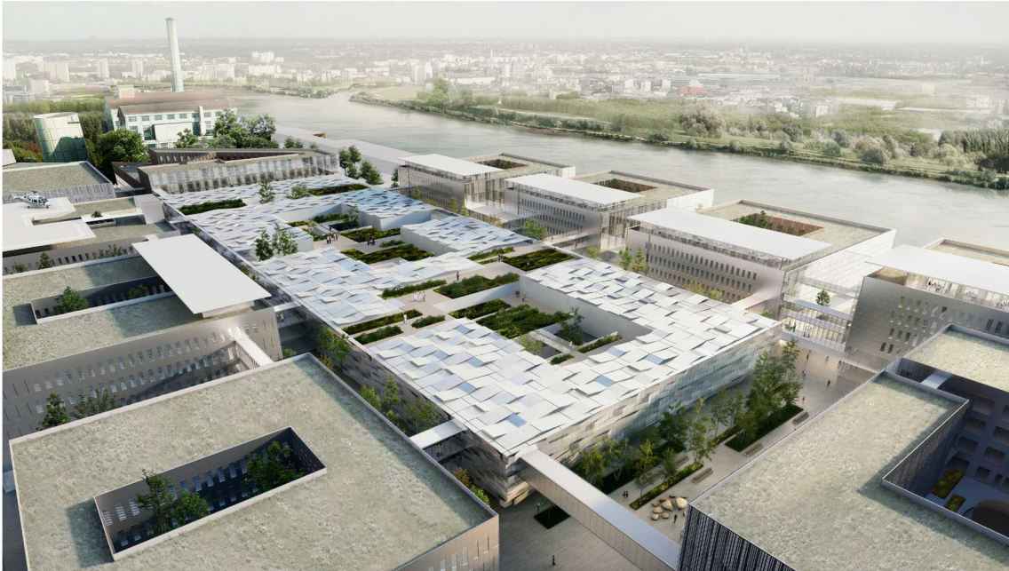
Nouveau quartier hospitalier de l'île de Nantes, en collaboration avec Jean-Philippe Pargade et Signes Paysages