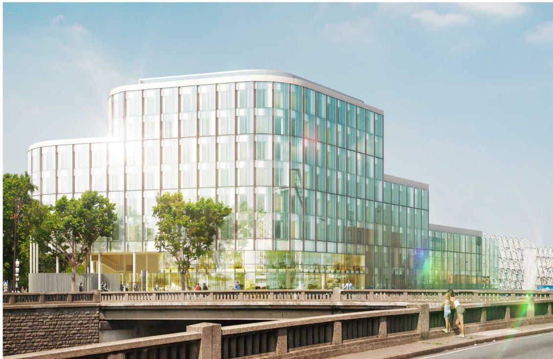
Opalia, immeuble en construction bois, avenue de la Porte d'Ivry, Paris

La biodiversité est un vecteur essentiel de la ville résiliente et durable. Faute d'étude scientifique pour l'objectiver, Art & Build a initié une vaste enquête pour identifier les obstacles à l'acceptation par le public et les professionnels des initiatives d'amélioration du taux de biodiversité dans les villes. L'analyse des données sera mise à disposition de tous les acteurs de l'immobilier pour les aider à mieux communiquer sur le sujet.