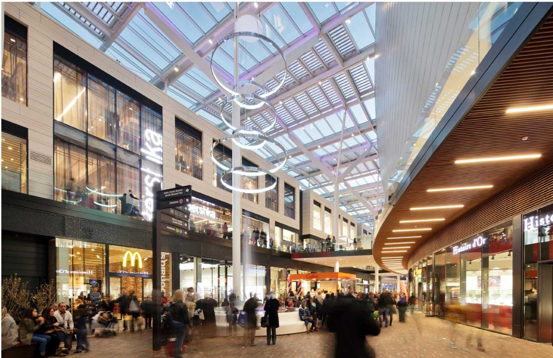
Docks Bruxsel, pôle de commerces, d'activités et de loisirs, Bruxelles