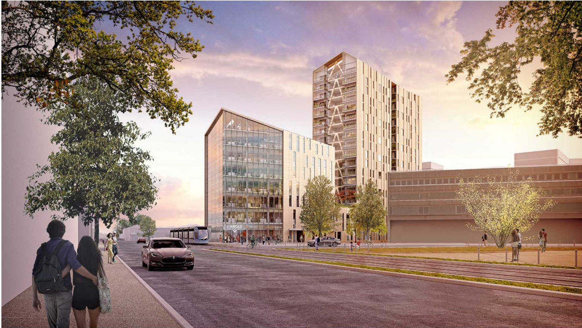
Silva, projet mixte en construction bois, Bordeaux, en collaboration avec Studio Bellecour