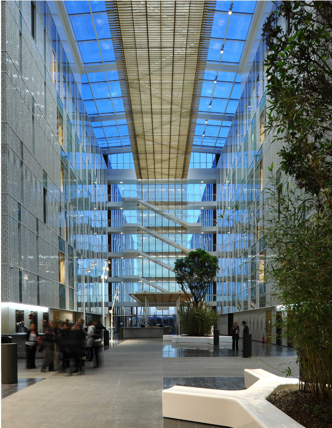
Atrium, siège du Groupe Up, Gennevilliers, en collaboration avec Jean-Paul Rozé