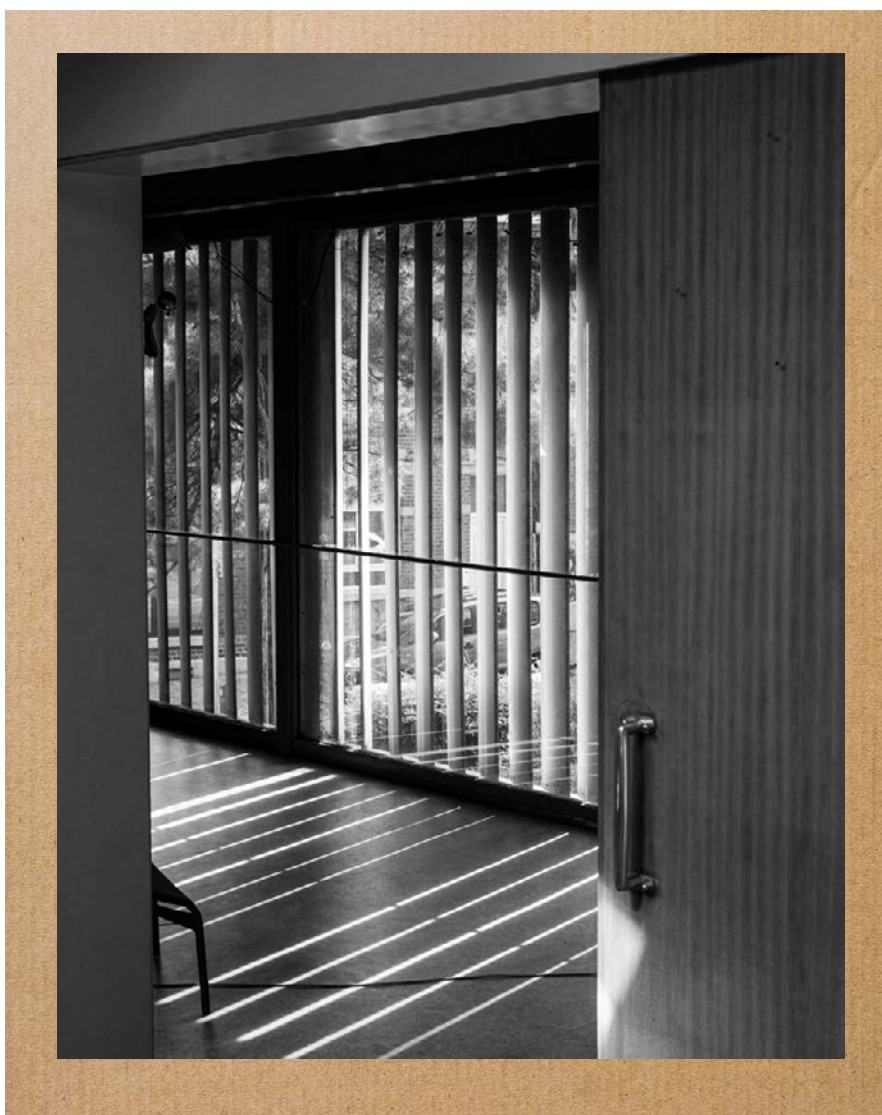
Atelier dans la maison de Louis Bosny

Cité Radieuse Le Corbusier de Briey-en-Forêt Galerie Blanche