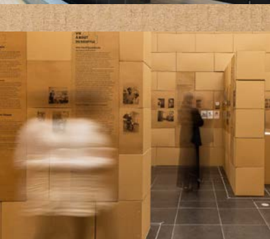
Exposition à la Cité Miroir, Liège