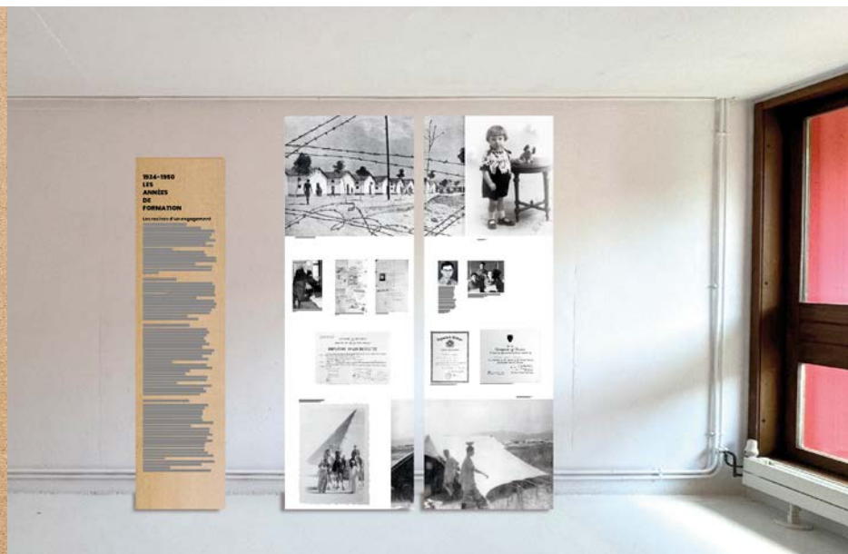
Photomontage / croquis pour la préparation de l'exposition dans la Galerie Blanche

L'exposition sera visible dans la Galerie Blanche de La Première Rue, du 22 mars au 23 mai 2025. Vernissage ouvert à tous, le 22 mars à 17h.